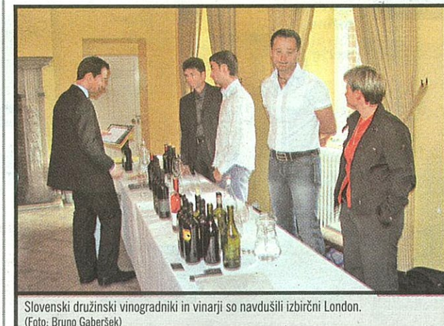
Slovenski družinski vinogradniki in vinarji so navdušili izbirčni London.