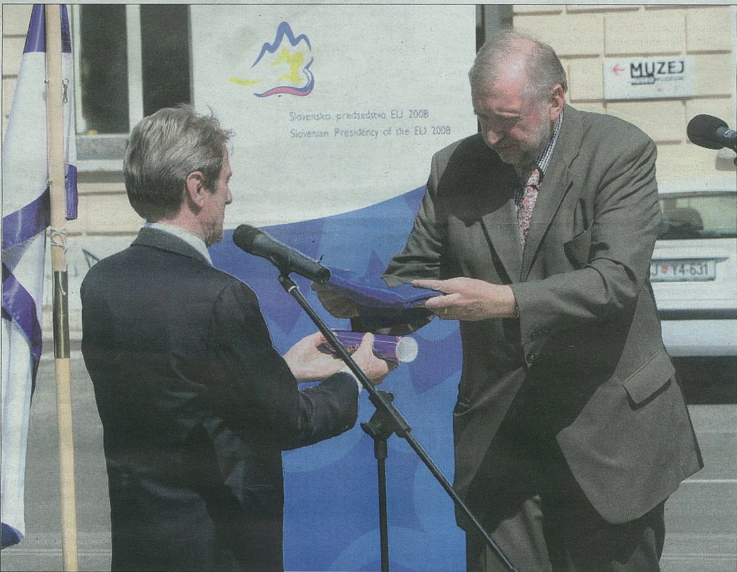
Slovenski zunanji minister Dimitrij Rupel predaja francoskemu kolegu Bernardu Kouchnerju štafetno palico in zastavo Evropske unije

Zunanja ministra Rupel in Kouchner na skupnem trgu