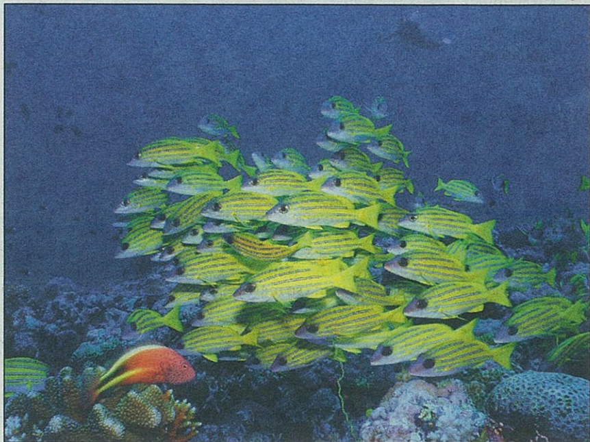
Olympus SW 1030 med ribami koralnega grebena

ublaženem padcu smo se še nekaj časa kruto igrali z njim, verjemite mi, da dovolj za vse normalne potrebe. Na koncu je še zmeraj delal.