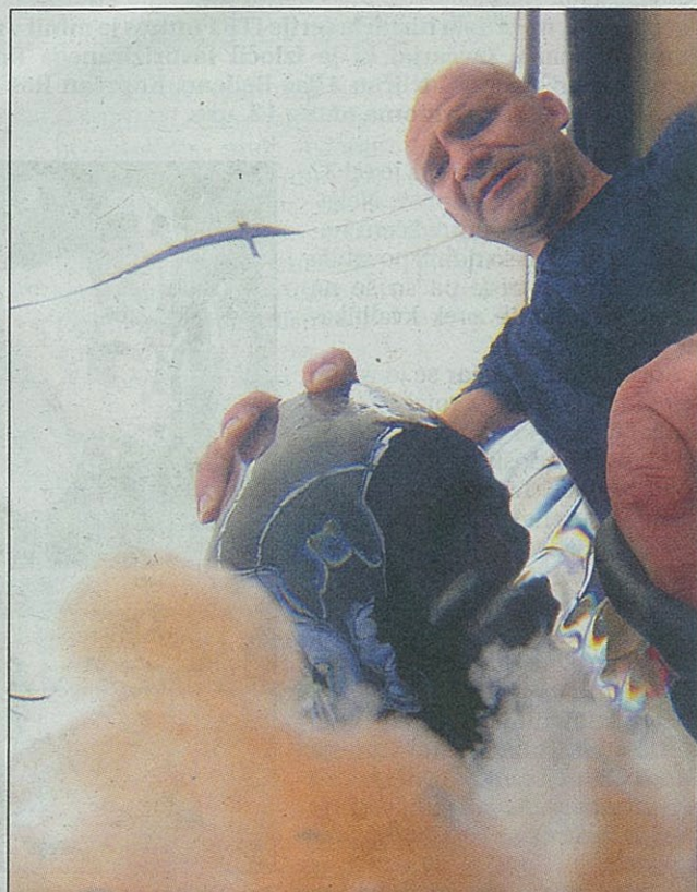
Trenutek škljoca in "poka" pod vodo, ko kvasovke izrine pritisk roseja Puro