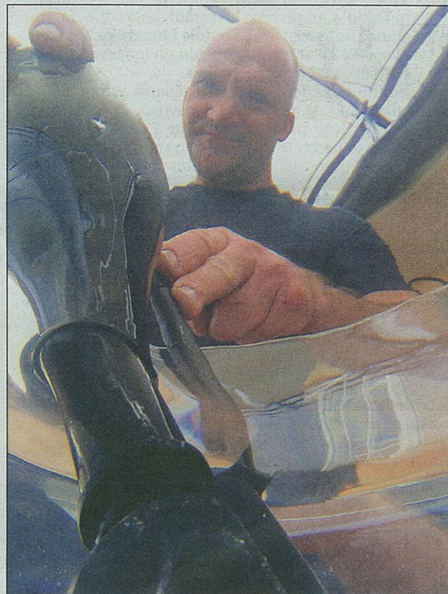
Namestitev steklenice na ročaj za podvodno odpiranje