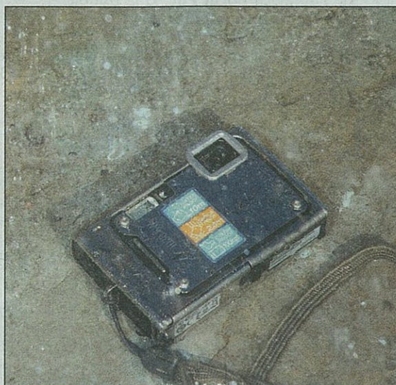
Spiranje z sladko vodo po uporabi v morju je obvezno