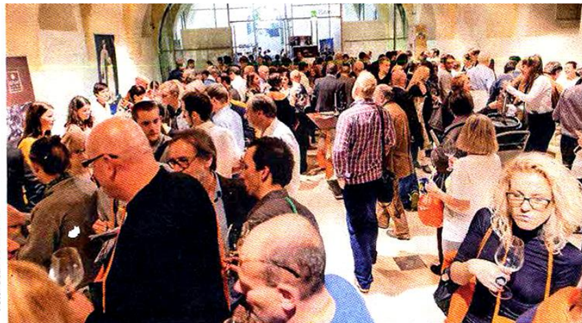
Gneča na Festivalu oranžnih vin v nekdanjih cesarskih konjušnicah

Drugi dunajski festival oranžnih vin je zbudil veliko zanimanje tamkajšnje javnosti