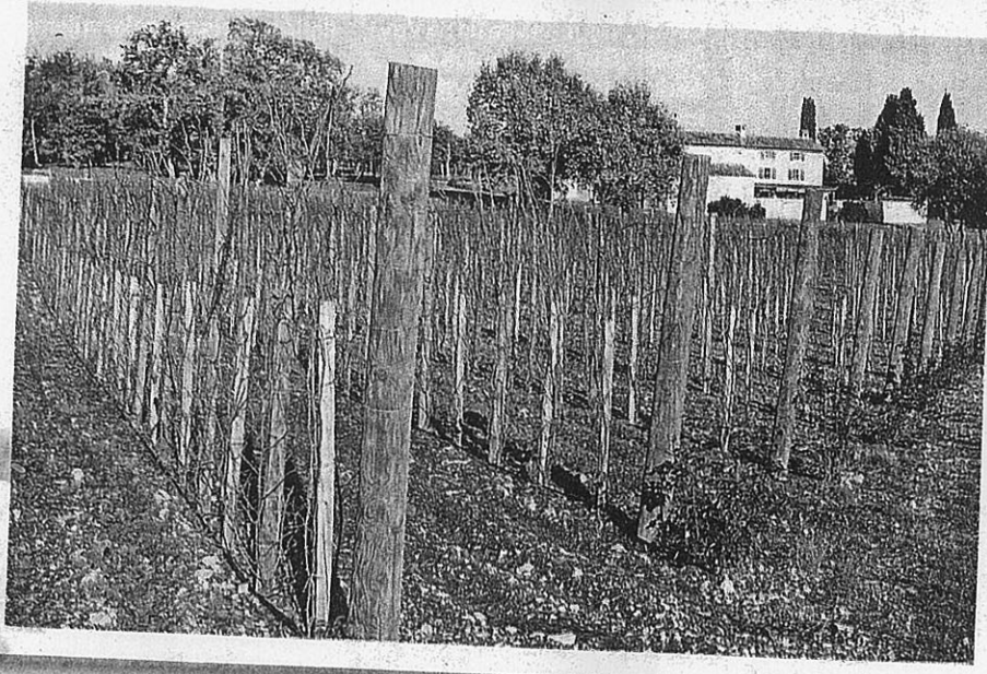
Prva serija vina s etiketom Meneghetti promovirana je na stanciji Meneghetti; vinogradi unutar imanja