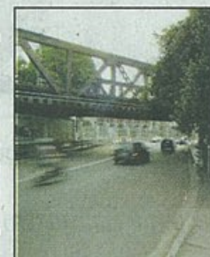
Barcola, il cavalcavia