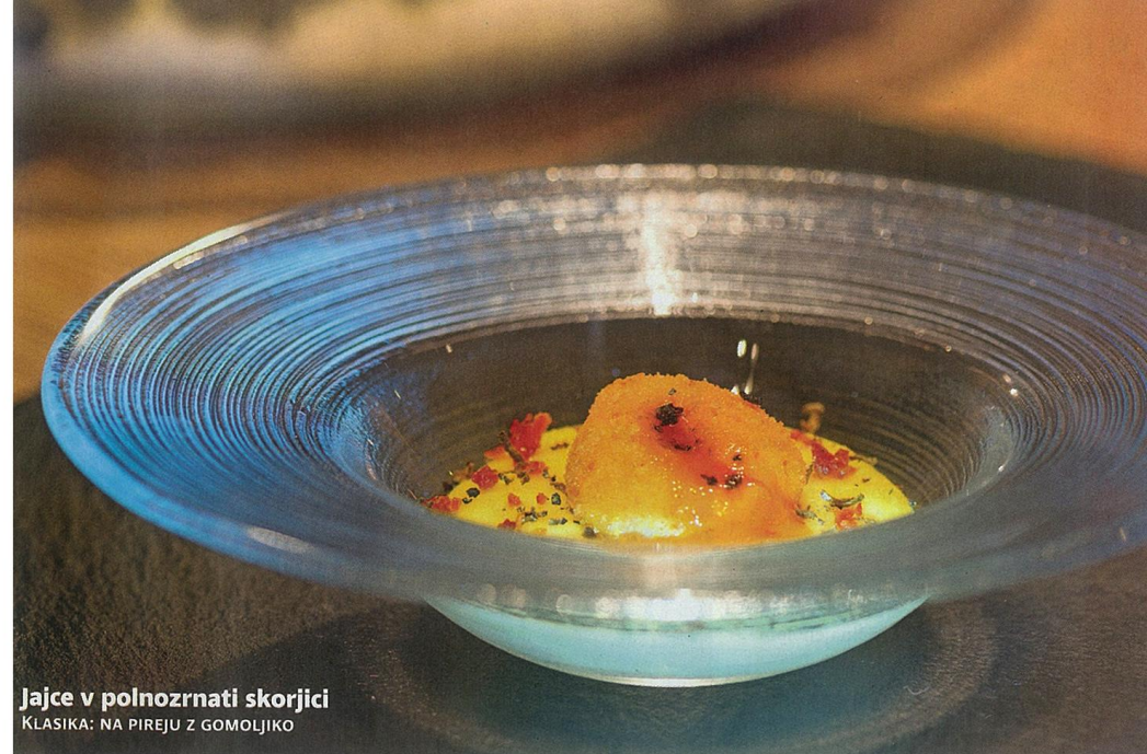
Jajce v polnozrnatni skorjici KLASIKA: NA PIREJU Z GOMOLJIKO