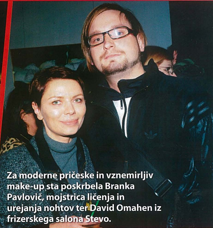
Za moderne pričeske in vznemirljiv make-up sta poskrbela Branka Pavlovič, mojstrica ličenja in urejanja nohtov ter David Omahen iz frizerskega salona Stevo.