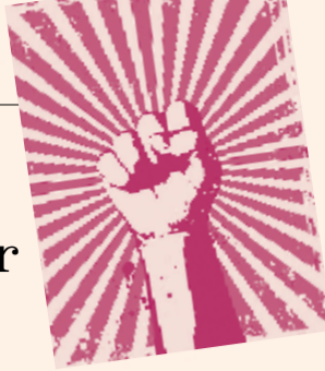
BERICHT AUF SEITE 3