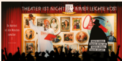
BERICHT AUF SEITE 4