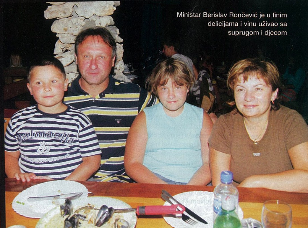
Ministar Berislav Rončević je u finim delicijama i vinu uživao sa suprugom i djecom