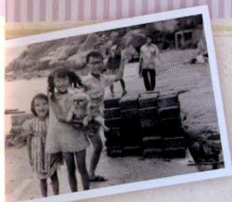
老三，老五和寵物 Angel 小孩不識愁滋味，全因上兩輩的人堅毅和涵忍。今天小孩動輒玩自殺，家長們自我檢討吧！

自此，我們周末的活動，就是挖屋遊戲，將屋子從泥濘中挖出來。當時我二年級，國文剛好教愚公移山。三層樓的泥濘罷了，總能挖出來的。小時候也不知道是逆境了，只見