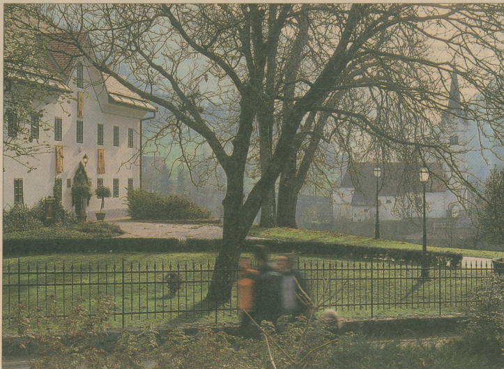
V Kendovem dvorcu menijo, naj država pomaga tistim, ki turistom ponujajo nekaj posebnega, avtohtonega, res slovenskega.