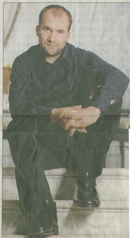
PETER SIFFERT (3)/PD

gel. Tatsächlich handelt es sich um ein zusammenhängendes kleines Gebiet, das beidseits der Grenze ganz gleich aussieht: Hügel eben, mit Wald, Rebärten, Wiesen – eine stille Landschaft in Grüntönen.