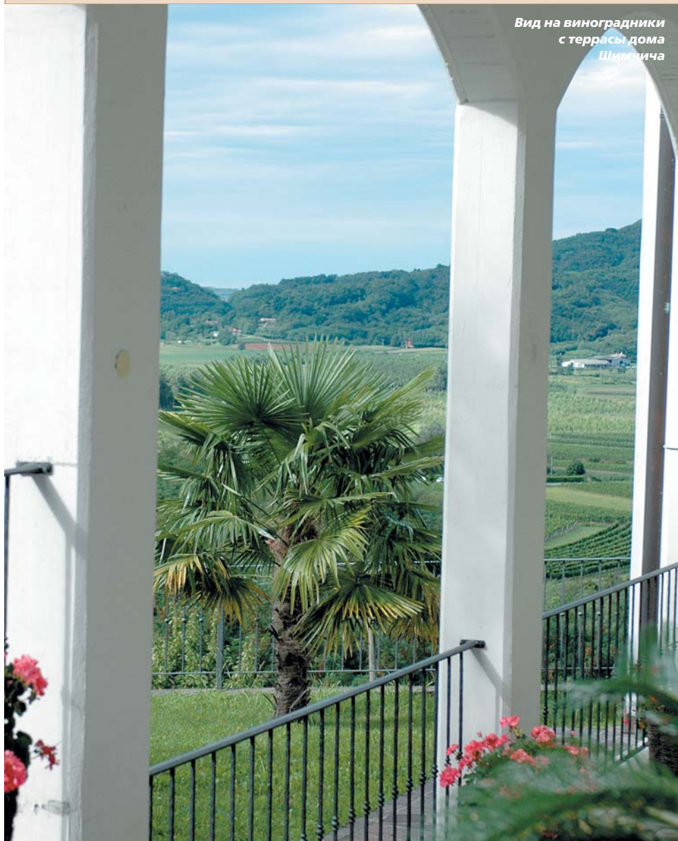
Вид на виноградники с террасы дома Шимчича

вручную с 50-летних лоз виноград тщательно сортируют, отбирая только целые ягоды, сушат на открытом воздухе под навесом до апреля (!), а затем дают сок. Из 5000 кг ягод получается всего 400 литров сула. Натуральная ферментация проходит в бочонках из французского дуба объемом 130 л. Вино не очищают и не фильтруют. В результате в бокале вино рассыпает золотые блики, и в мощной концентрации ароматов хорошо различимы засушенные фрукты, ваниль, мед и цветущие в июльский полдень цветы. Медитативное вино с потрясающим потенциалом выдержки. Любители сигар выбирают в дополнение к нему классическую гавану.